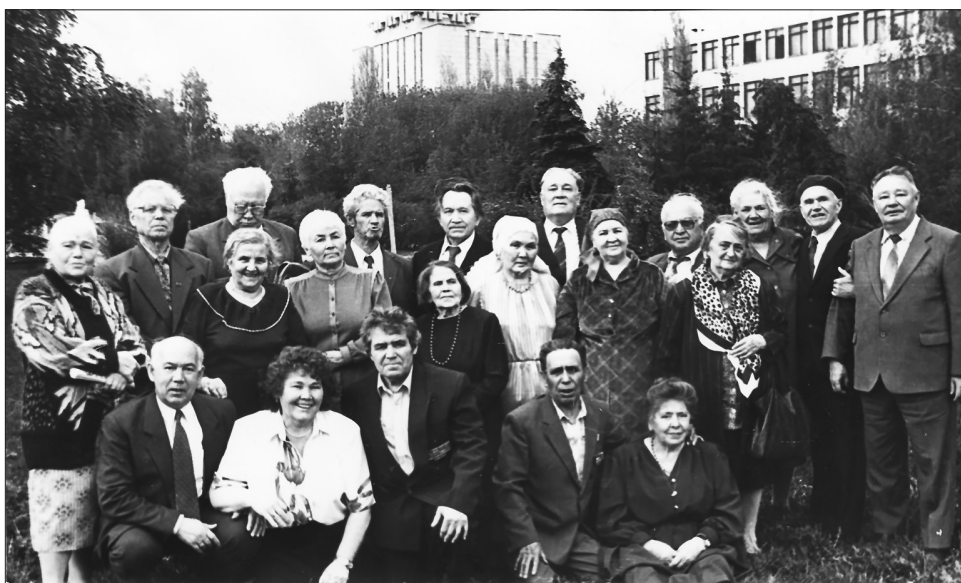
«Социалистик Татарстан» (хәзерге «Ватаным Татарстан») газетасы ветераннары. 2000 нче еллар.