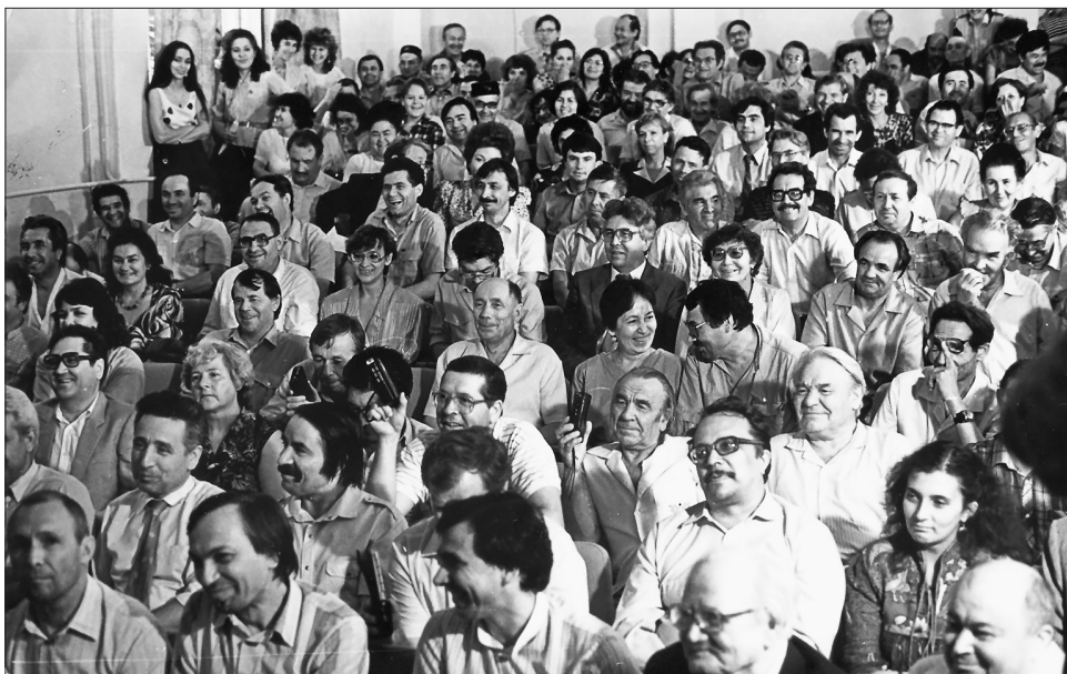
Россиянең Беренче Президенты Борис Ельцин белән очрашу истәлеге. Зал тулы язучылар, журналистлар, жәмәгать эшлеклеләре... Язучыларның Тукай клубы. 1990 ел.